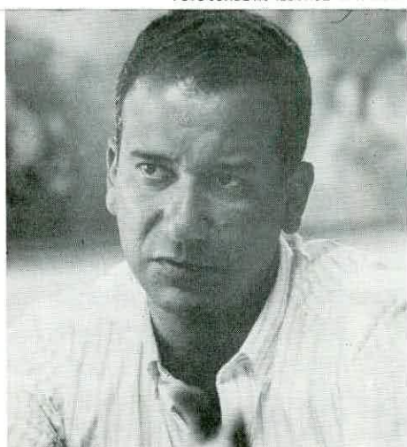
Cmt. Collares é diretor do FAD

um imóvel em Niterói, na Rua Dr. Sardinha, 91, com seis andares e dois apartamentos por andar com sala, dois quartos, suíte, dependência, play, garagem, salão de festas etc... Este imóvel será totalmente financiado pelo Fundo e está em adiantado processo de construção. Informamos também que já está em estudo o próximo lançamento imobiliário que será em São Paulo, (o FAD está estudando as áreas de Santana, Jabaquara e Vila Mariana) e já se encontram na Regional SAO, os formulários para os pretendentes se habilitarem para este lançamento.