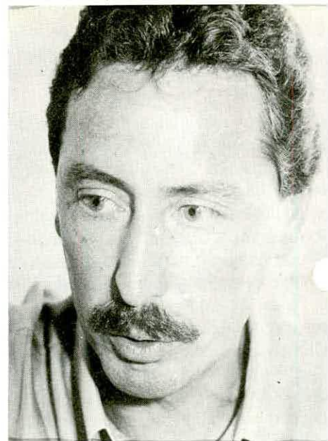
Cmte. Arnt voa MD-11 na Varig

tes, além de consumirem consideráveis quantias. Apesar disso conseguiu superar estes problemas e alcançar uma Convenção com avanços consideráveis. Outro ponto complicado foi a privatização da Vasp na qual a diretoria assumiu uma postura contrária a maneira como se deu o processo. Isto criou uma resistência numa parcela do grupo da Vasp, mas os atuais acontecimentos comprovam que o SNA estava correto.