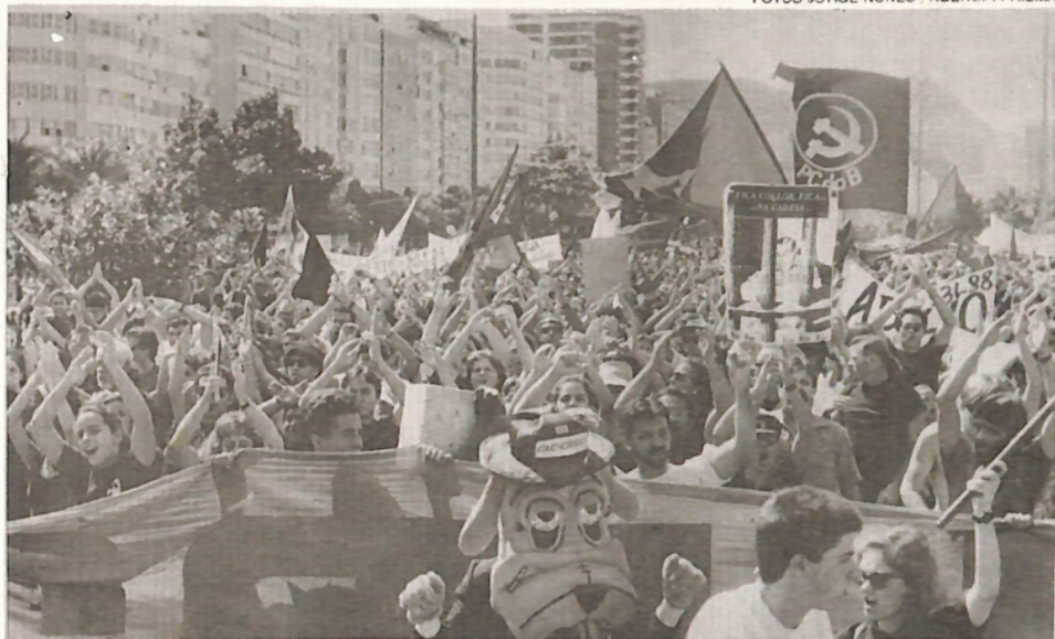
Flagrantes das manifestações de protesto realizadas no Rio de Janeiro