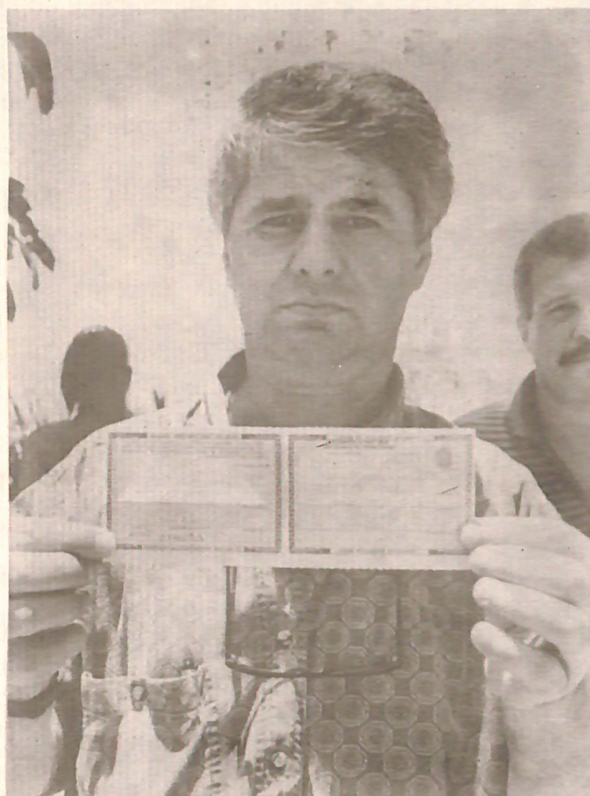
Cirtoli mostra certificado de habilitação emitido de maneira irregular

A denúncia da distribuição de cartões de habilitação de maneira ir-